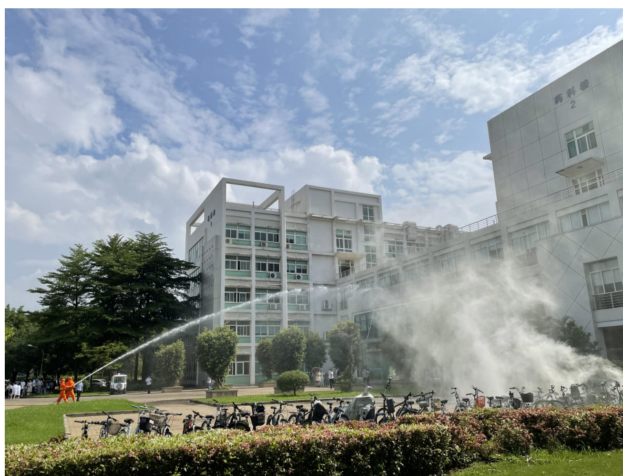
药科楼前燃气浓烟，消防人员迅速响应