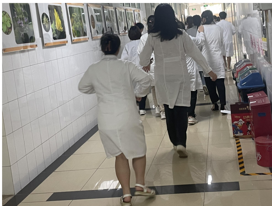
药科楼师生紧张有序撤离