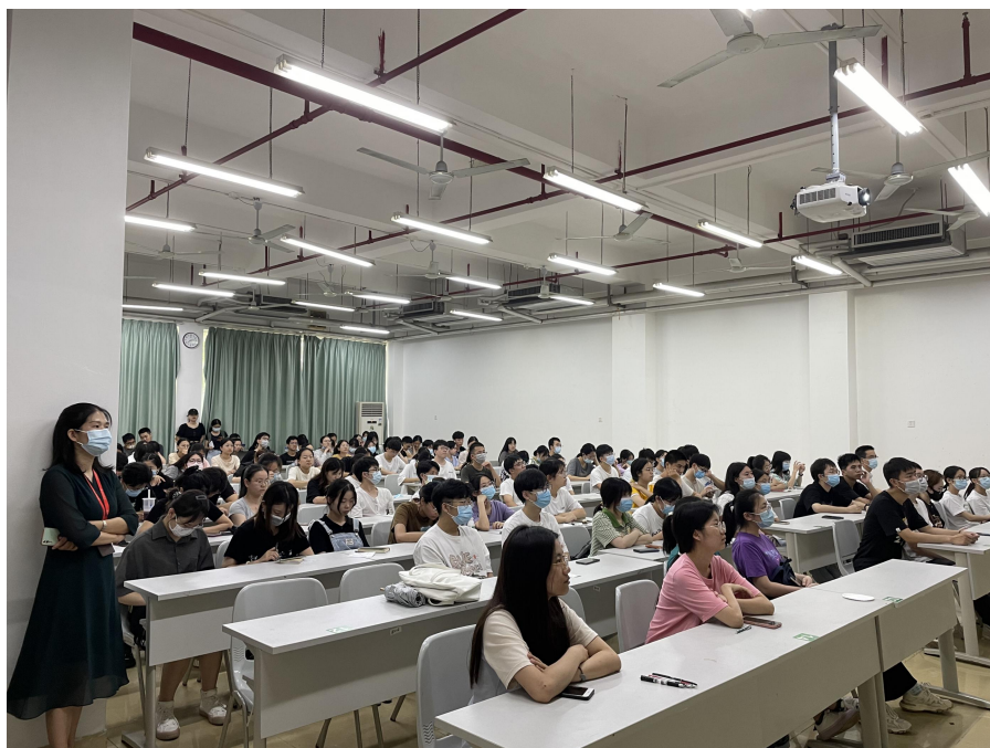
全体一年级研究生、辅导员参与消防讲座