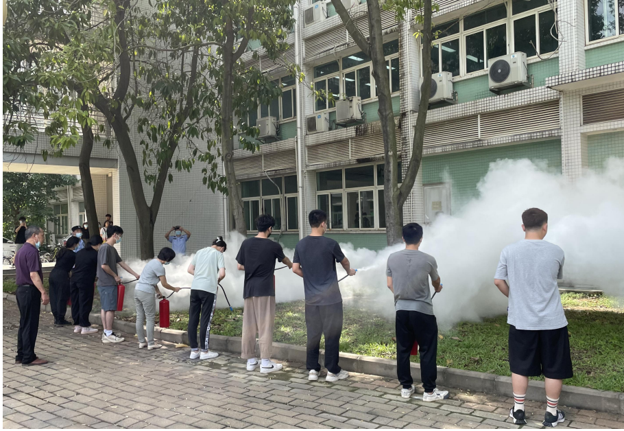
同学们进行灭火演练