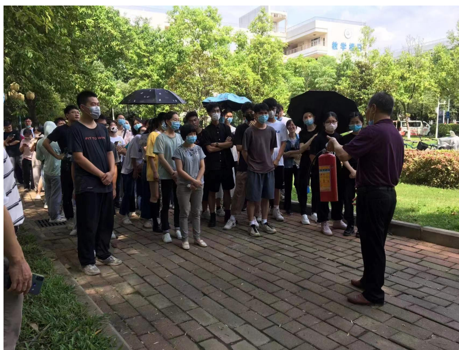
许科长指导师生使用灭火器