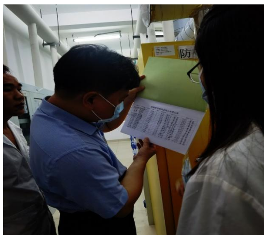
学院领导现场检查科研、教学危化品仓库